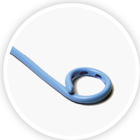
CATETER HIDRÓFÍLICO COM PONTA PIGTAIL