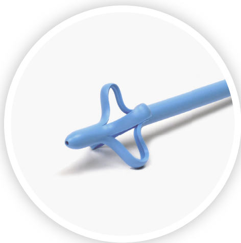
CATETER HIDRÓFÍLICO COM PONTA MALECOT